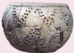
Verre chalcolithique de "Los Cercados". Musée de Valladolid.

Nous avons des sites archéologiques de silex du Paléolithique inférieur. Ces premiers hommes se sont installés sur le site de "Los Cercados". Lieu où on a trouvé des outils pour la sculpture et la céramique et trois crânes de femmes.